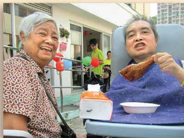
學員拿著燒鵝脾，吃得津津有味

當日下午陽光普照，熱情的學員家長來到宿舍後，便一起為晚上盛宴作預備，幫忙清洗食物，切生果做餐，精製配合學員口味的晚餐；家長也自攜生果和月餅，營造中秋樂也融融的氣氛。