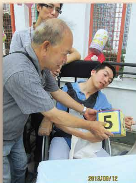
家人也落力一同和學員參與遊戲

讓大家快快地投入，節目首個環節便是遊戲時間，學員在家人和職員的協助下，玩玩家傳戶曉的「猜拳遊戲」，勝出者捧著豐富獎品，笑逐顏開。接著便到晚宴時刻，宿舍準備了到會食物及打邊爐，在月光影照下，家人和學員聚首一堂，彼此如家人般閒話細碎，熱騰騰的食物倍感窩心，共渡難忘溫馨的夜。