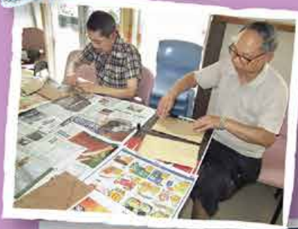
愛不釋手 環保擺設工作坊