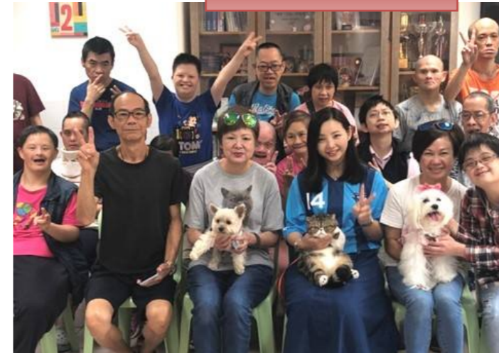
感謝毛小孩和主人的探訪，令學員很歡欣。