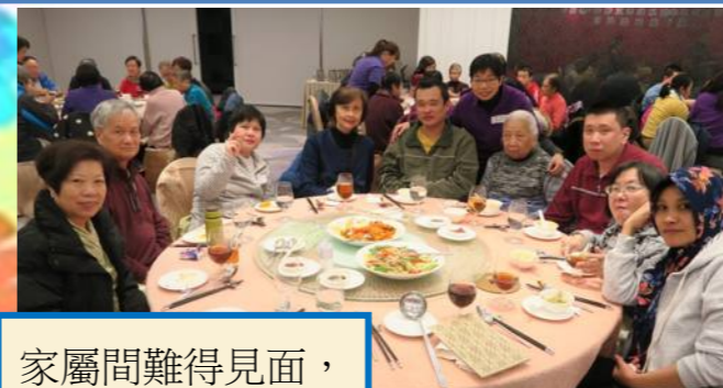
家屬間難得見面，自然打成一片！