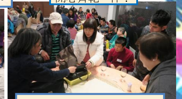
齊心合力，完成遊戲目標！