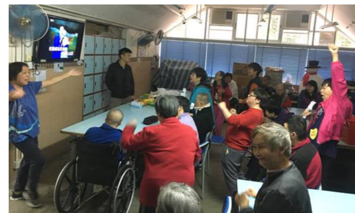
聖誕節前，義工與學員大唱 K 歌；既有懷舊金曲，亦有自選喜愛歌曲；義工與學員大聲唱、開心跳，真的樂而忘返！