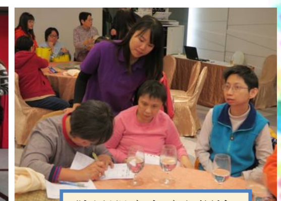
職員即席向家屬詳解進度評估內容。