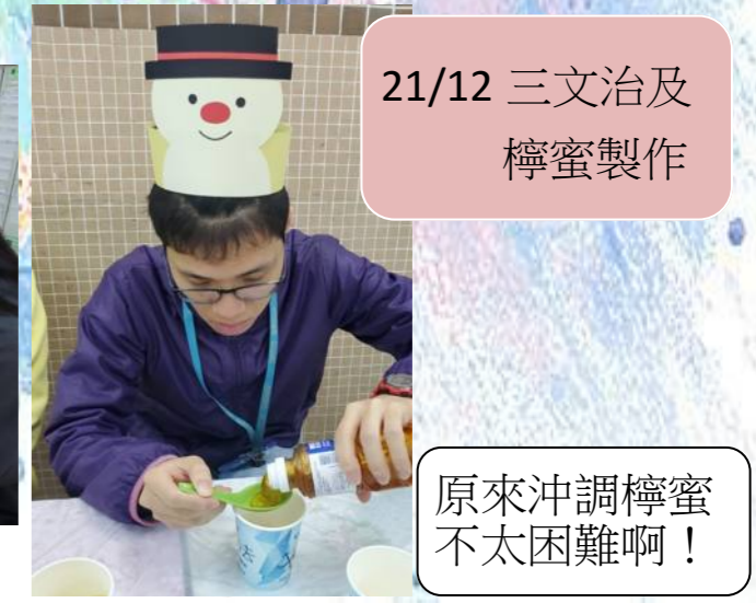
21/12 三文治及檸蜜製作 原來沖調檸蜜不太困難啊！