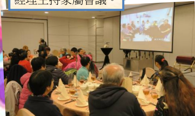
學員及家屬觀賞影片，了解學員會議的情況。