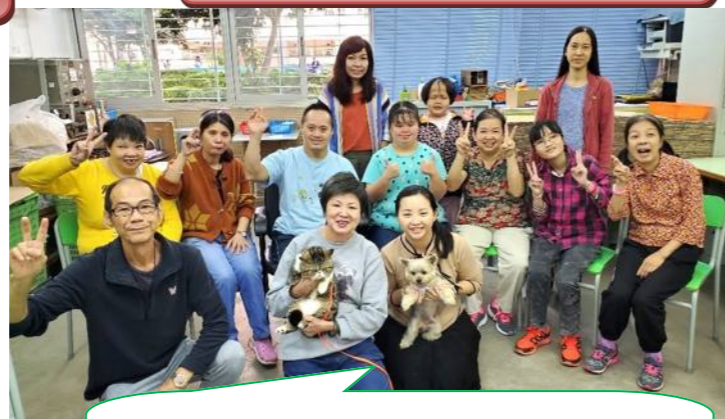
多謝貓狗義工們定期來工場與我們見面，我們已成為了好朋友！