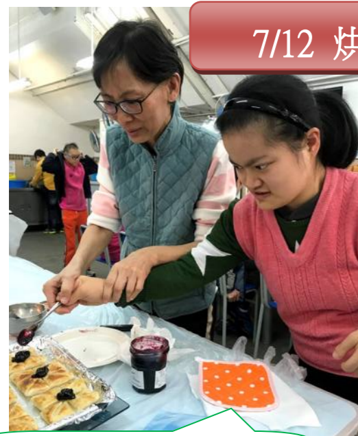
美味可口的酥皮果占批！