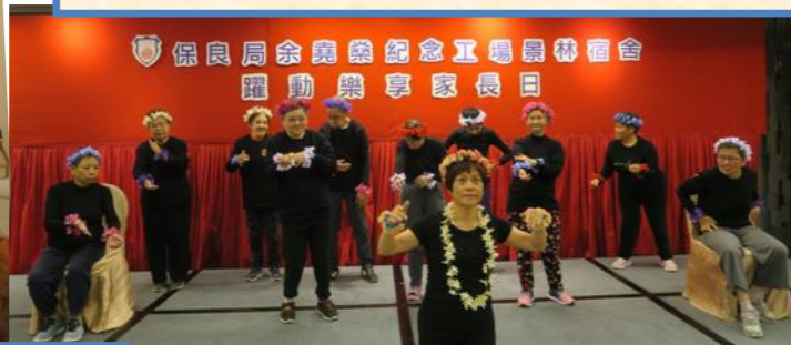
WEP 學員為大家表演手語舞。