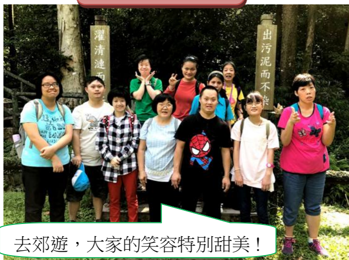
去郊遊，大家的笑容特別甜美！