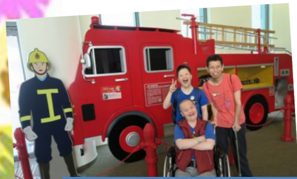
17/10 同遊消防救護博物館