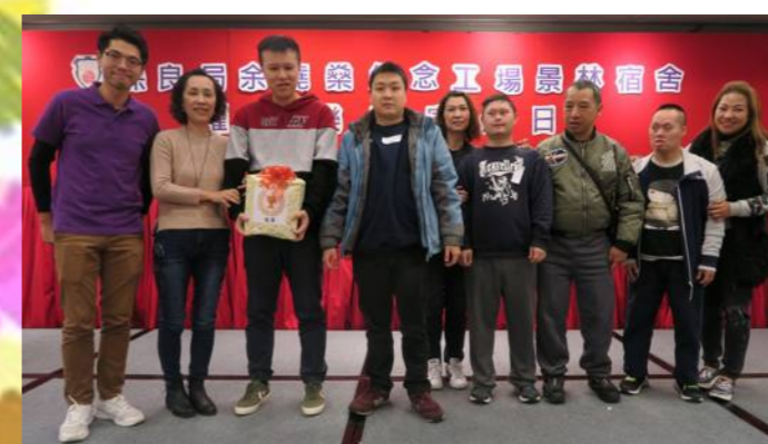
大家從遊戲中贏了友誼，是最佳的禮物！