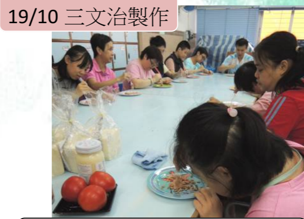
19/10 三文治製作 學員好享受製作食品的過程！