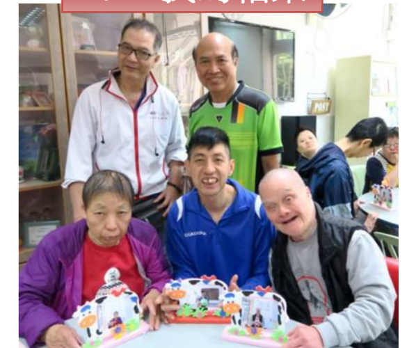
學員揀選喜愛的配飾，製作自己的相架！