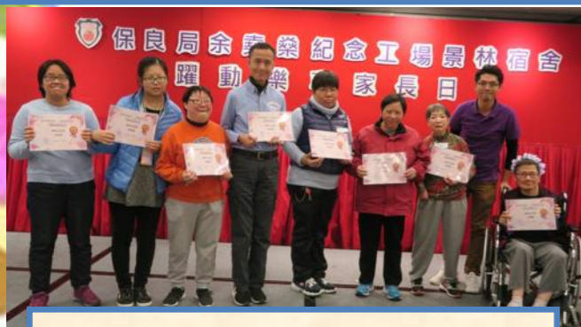
年度內的努力獲嘉許，繼續努力！