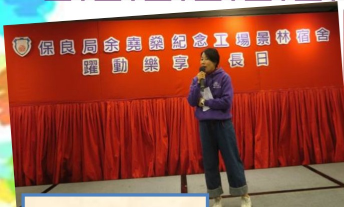
經理主持家屬會議。

於 8/12 工場和宿舍配合單位「躍動自主，樂享生活」年度主題合辦「躍動樂享家長日 2019」，讓家長、學員及職員共聚，了解單位動向、欣賞學員本年度的成就和表現，共享快樂時光！活動內容豐富，包括家屬會議、年度主題節目、集體遊戲、學員表演、午膳，及派發年度進度評估等。當日活動順利完成，共有 56 位學員、64 名家屬，和 1 名義工參與活動，在此非常感激各位對單位的支持！