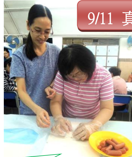
自制酥皮腸仔包，好好食！