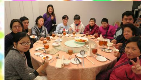
學員及家屬在愉快的氣氛下交流、共聚。