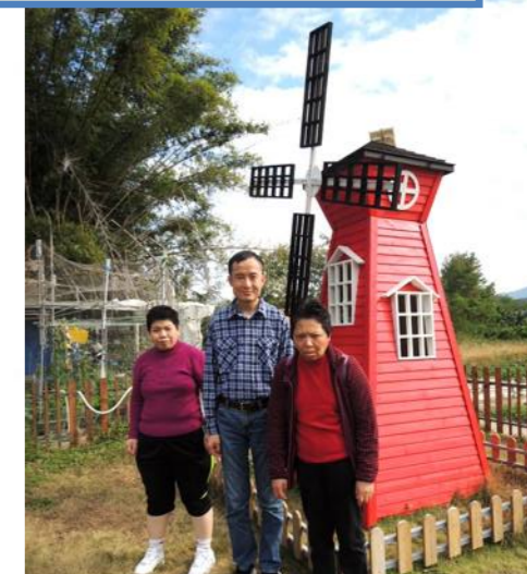
暖暖冬日，親親大自然！