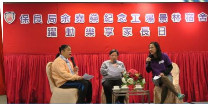
年度主題節目中，邀請學員代表與大家分享如何在服務中發表自己的意見。