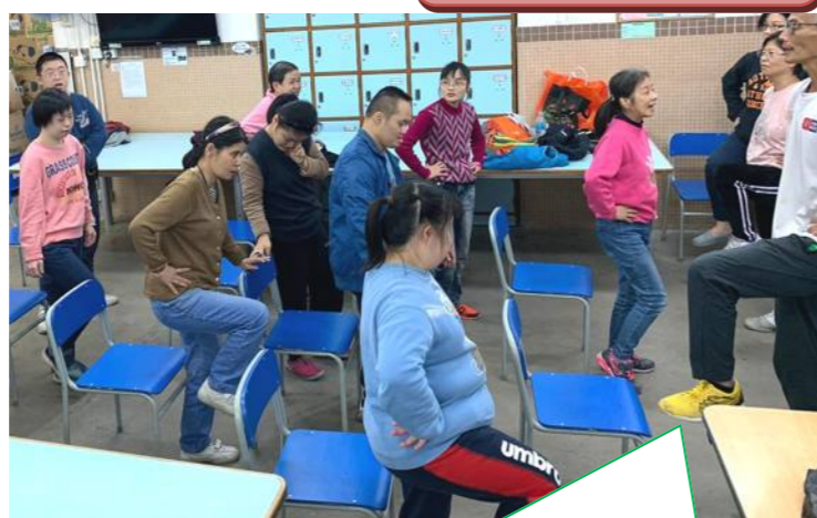
健體老師風趣幽默，學員一邊做運動，一邊哈哈大笑！