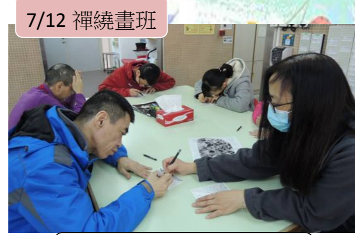
7/12 禪繞畫班 學員都很認真畫禪繞畫！