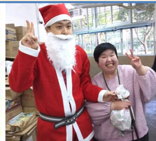
太高興了！有聖誕老人派禮物！