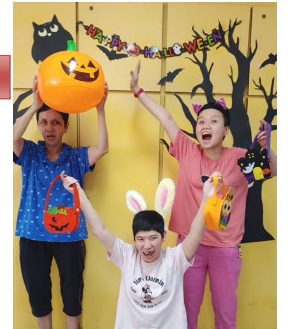
扮鬼扮馬，真有趣、好玩！