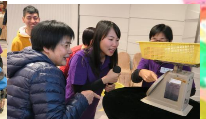
家屬與職員同樣緊張遊戲成績！