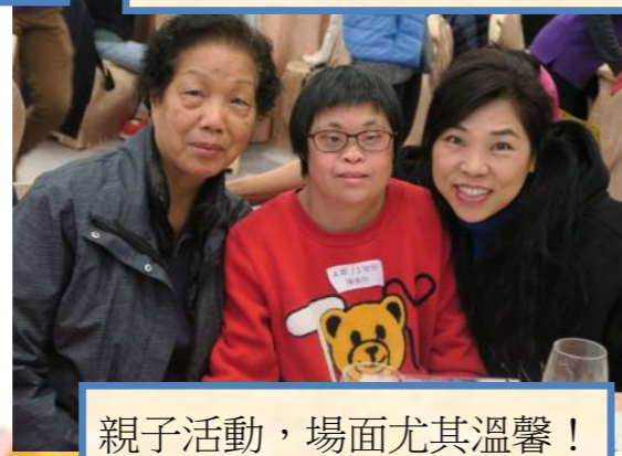
親子活動，場面尤其溫馨！