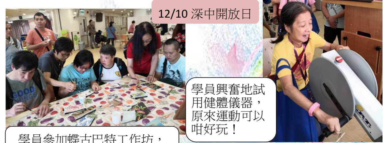
12/10 深中開放日 學員參加蝶古巴特工作坊，製作個人化圖案筆袋和錢包。

工場周六多元活動已開展第二季，各負責導師在活動中施展渾身解數，舉行多樣化的活動，使學員在享受過程當中，又能學習新技能，一舉多得，一起看看花絮吧！