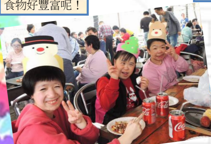
齊來戴上可愛聖誕帽應節！