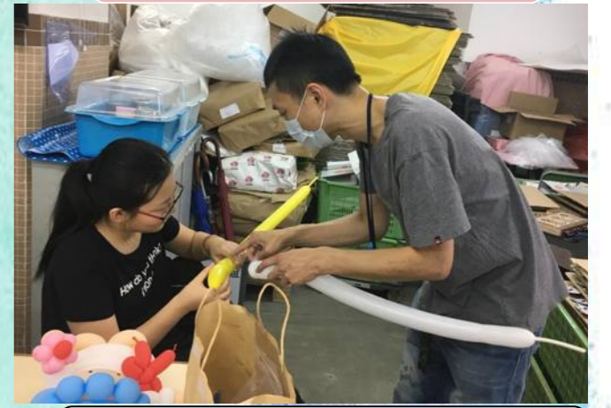
2/11 開心扭氣球體驗 氣球形態千變萬化，真有趣！