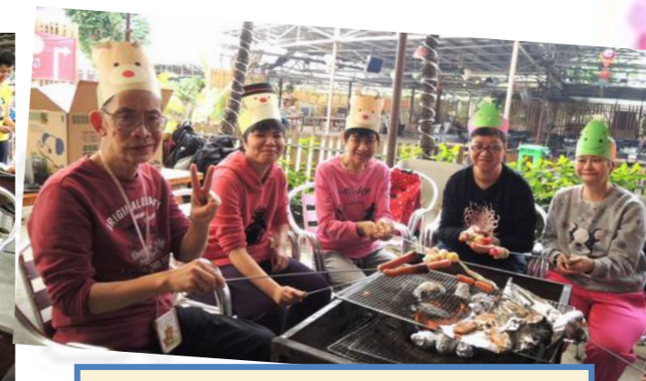
比心機燒烤、努力享受美食！