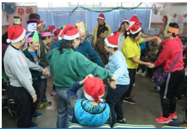
聖誕舞會是聖誕節重要的活動之一！