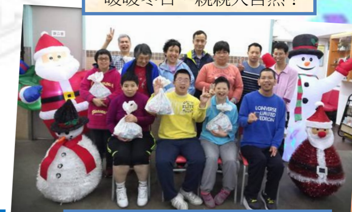
大合照有聖誕飾物和禮物相伴！