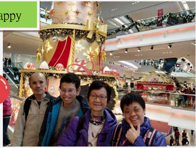
學員和義工聖誕合照，特別開心!