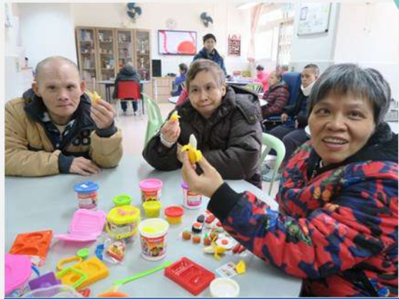
用泥膠搓出不同食物，香蕉嚟架!