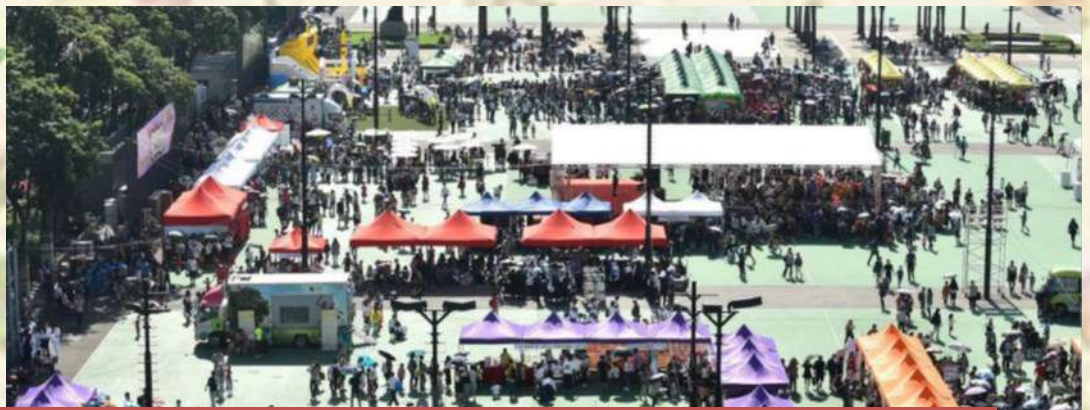
萬多名市民一家大小到維園參與保良局 140 周年服務巡禮。