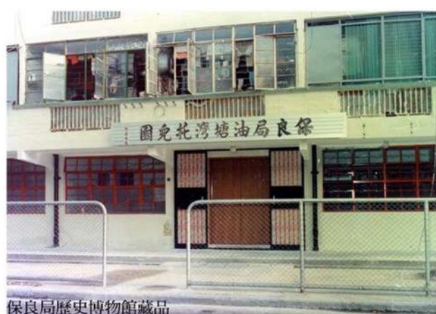
保良局歷史博物館藏品 PO LEUNG KUK MUSEUM COLLECTIONS