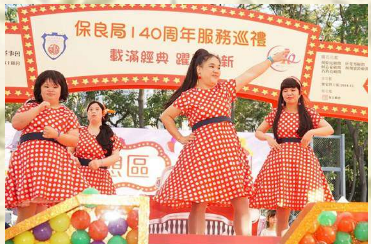
學員以「懷舊歌舞」作表演，真係配合大會主題。