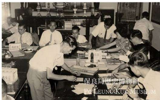
保良局歷史博物館 PO LEUNG KUK MUSEUM

保良局賣旗籌款的前身為「賣花籌款」，始於1939年。由留局婦孺製作紙花作募捐之用（上圖為局中婦孺製作紙花的情況）。1957年起改為「賣旗籌款」，以紙旗代替紙花。下圖為1962年，保良局同人於主席室點算善款的情況。