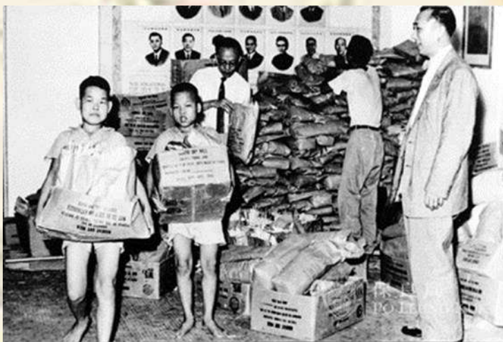
1960年本局以自製麵條2500磅運往香港仔魚市場救濟風災災民

19世紀末的香港，誘拐婦孺、逼良為娼、販賣人口的事情經常發生。於1880年5月港督批准及1882年8月英國理藩院通過「保良局條例」，設立保良局。「保良局」的「保良」二字，指保赤安良的意思。初期的工作為防止誘拐，保護無依婦孺，並協助華民政務司調解家庭與婚姻糾紛。現已成為一個龐大的社會服務機構，提供優質多元的服務。