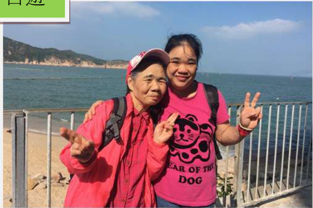
長洲海灘，吹吹風，天氣晴朗，笑容滿面!