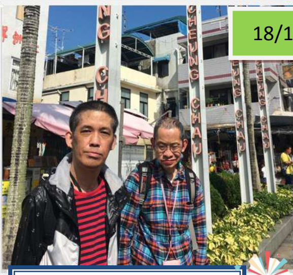
免費乘車日，義工與學員去長洲一日遊，好正啊!