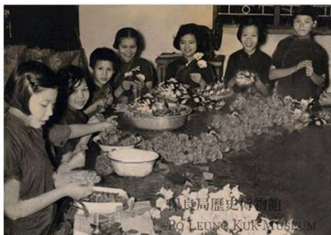
保良局歷史博物館 PO LEUNG KUK MUSEUM

踏入60年代，香港工業發展一日千里，婦女外出工作的情況漸趨普遍，為免幼童在家乏人照料，政府積極推動托兒園的設立。