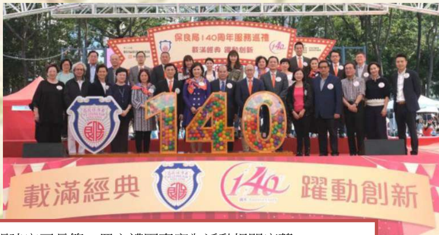
張建宗司長等一眾主禮團嘉賓為活動揭開序幕。

今年是保良局創局 140 周年。為隆重其事，保良局於 21/10/2018 匯聚轄下所有服務，在其服務發源地銅鑼灣舉辦「保良局 140 周年服務巡禮」，與全城同慶見證善業新里程。當日由政務司司長張建宗主禮揭開活動序幕，並透過不同的攤位遊戲和展覽，向公眾人士展現保良局的多元化服務。