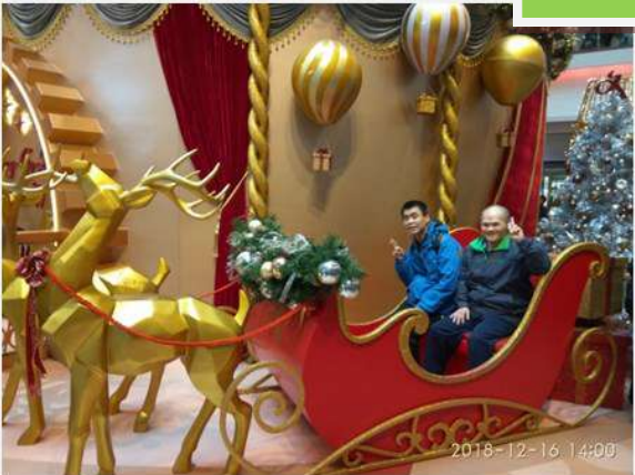
聖誕坐鹿車，特別有氣氛!!