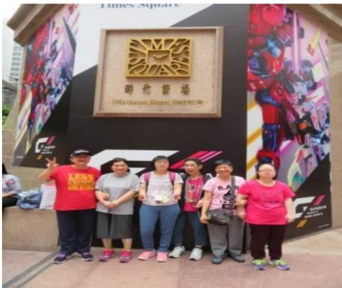
學員們於時代廣場拍照留念