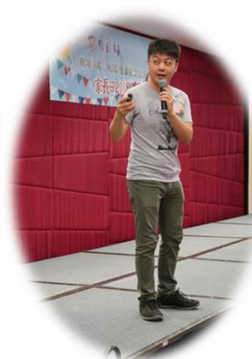
職業治療師講解家居安全的重要性及常見危機，提醒家屬多加留意。