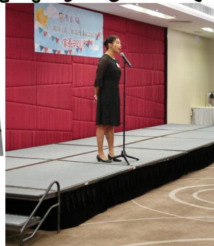
冼主任為來賓介紹工場及宿舍服務概況