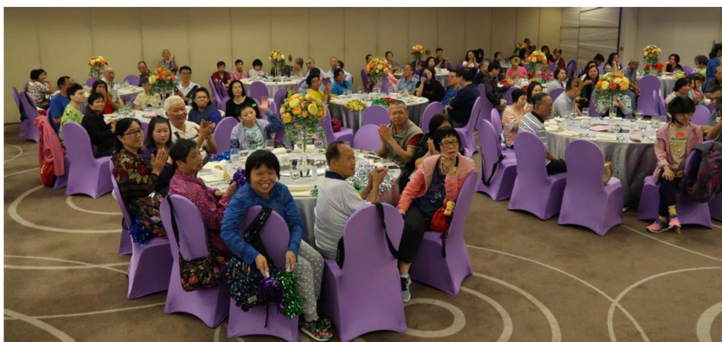
學員與家人共聚天倫