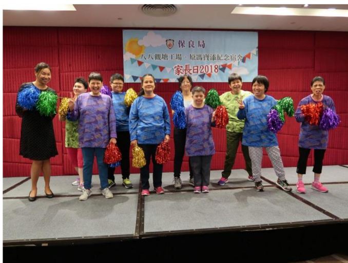
學員組成啦啦隊表演跳舞，雖然是首次表演，但十分賣力，表現專業。

一年一度的家長日活動於 8 月 26 日順利完成，當天除了豐富的節目外，參加者還一同享用自助餐，學員與家人藉此機會共聚天倫。