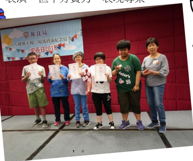
工場及宿舍於較早前選出各傑出學員，於頒獎禮上表揚並鼓勵他們繼續保持良好表現。