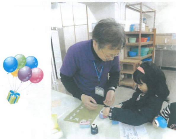
如果不懂得做,還有職員認真講解和教授。