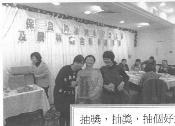
抽獎，抽獎，抽個好運臨頭呢!