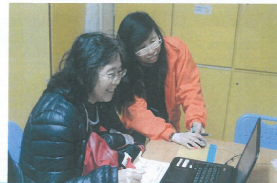
眼睛健康也重要!你做了色盲測驗了嗎?