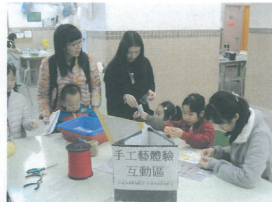
小朋友於手工藝體驗互動區內玩得真投入~