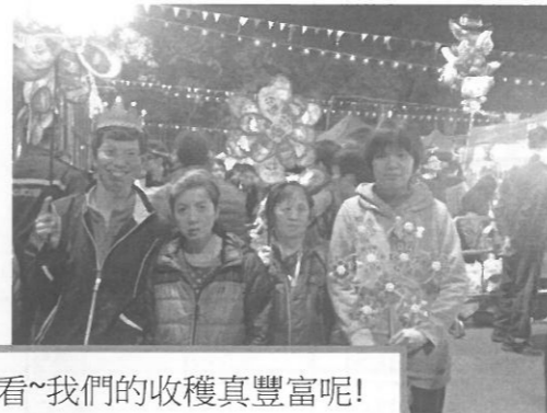
看~我們的收穫真豐富呢!