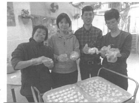
下午我們還一起製作湯圓做下午茶，不亦樂乎!