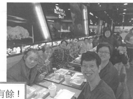
YEAH~新年快樂^^年年有餘!

大年初一宿生在 3 名職員及 1 名義工的帶領下到邨內餐廳享用西式早餐，別有一番風味。