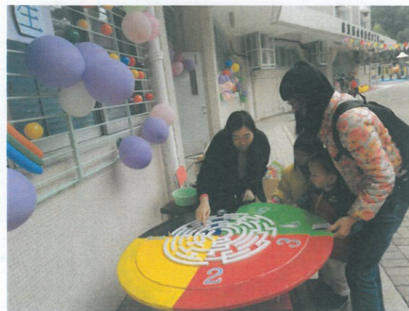
工場門外還擺設有適合老少咸宜的有獎攤位遊戲。