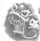
咩~祝大家羊年快樂!