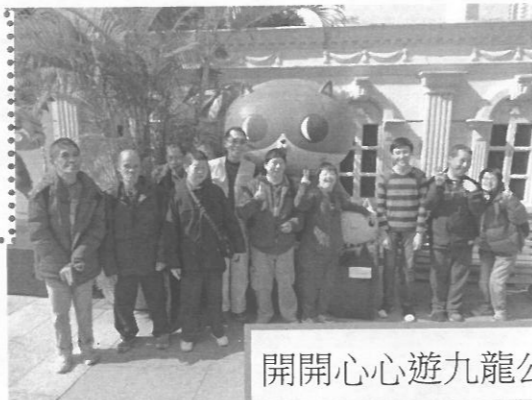
開開心心遊九龍公園!