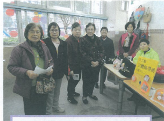
你看,學員一家大小也來撐場!

工場及宿舍於 7/3/2015(星期六)舉行『樂在社區、活出精彩』開放日活動,內容包括:銷售服務、手工藝示範、健康資訊、攤位遊戲等,參與的社區人士達 571 人次,由於是次開放日共有 30 名學員透過即場示範及以不同形式協助活動進行,令社區人士對殘疾人士有更多了解和認識。