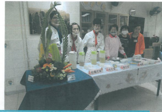
於宿舍大廳多了一班廚藝了得的大廚!