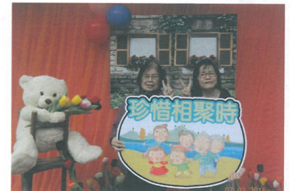
「樂籬」影相區內的大熊真是深受歡迎!