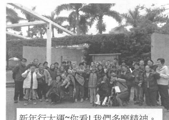
新年行大運~你看! 我們多麼精神。