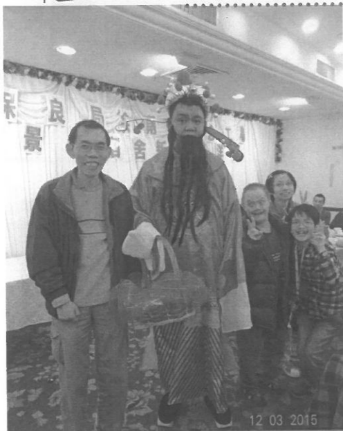
除舊迎新，當然不少得高大威猛的財神爺啦~