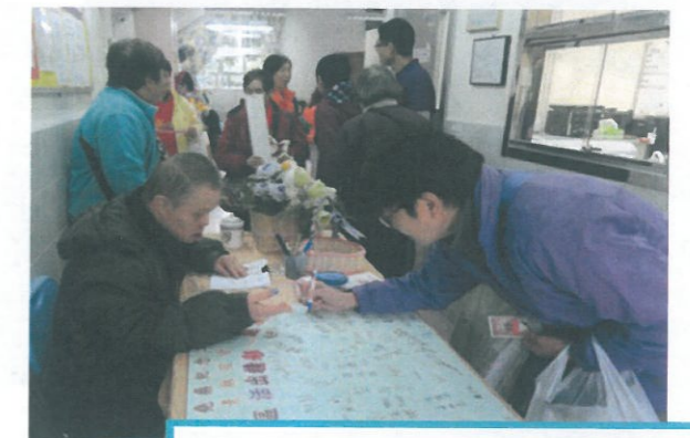
殷勤地接待客人,是我們的宗旨呢!