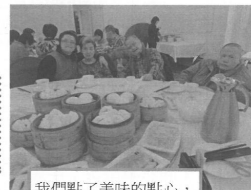
我們點了美味的點心，很好吃的呢!