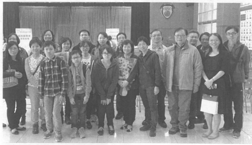
獲獎同事有這麼多家人、上級及同事捧場，真是令人感動。

光陰似箭！日月如梳！轉眼間我已經在保良局余堯燊紀念工場服務二十一個年頭，回想起當初加入這個大家庭時都抱著全心全意、一路學習的精神，服務我們的服務對象；和我們一班同事共渡過多少過春與秋、喜與樂，真有點依依不捨，天下無不散之筵席。在此祝福各位百尺竿頭！更進一步！