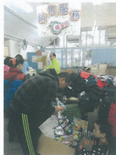
過來睇!過來買呢~綠苗坊的貨品「平、靚、正」呀!