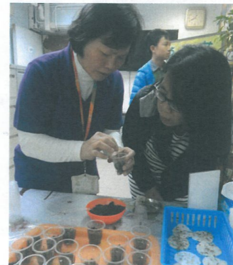
種子是否能夠成長,原來有不少學問。