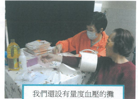
我們還設有量度血壓的攤位,得到不少街坊的光顧!