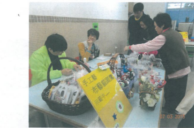
負責示範的學員正在密密手地製作拿手的作品呢!