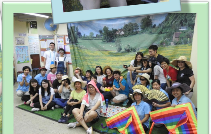
觀工/原宿同事一起湊熱鬧，渡過开心的特飾便服日