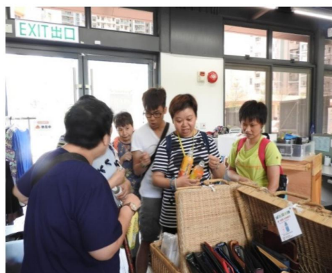
環保工作我做得到