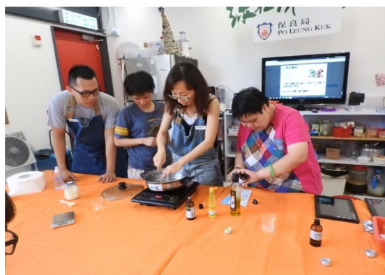
動動手製作驅蚊膏