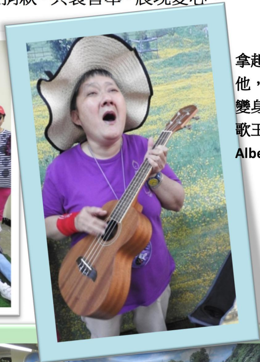
拿起小結 他，個個都 變身成為民 歌王子 Albert Au