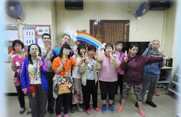
身穿彩色衣服的學員品嚐著彩色冰條