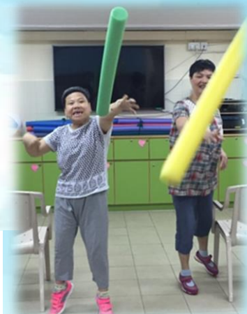
活力棒鍛鍊學員的肢體靈活及協調