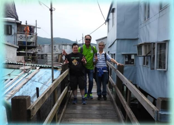
義工向學員介紹大澳的景點