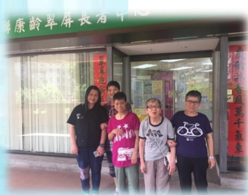
到長者中心與區內老友記交流