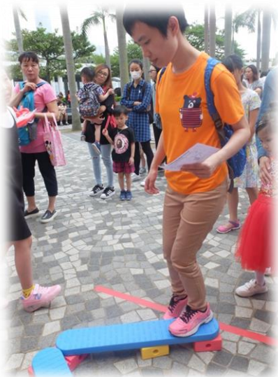
學員參與攤位遊戲，加深對局內服務的認識

20 位學員於 5 月 20 日參與由保良局舉辦的慶回歸活動，加深學員對局方不同服務的認識。同時透過開幕典禮、升旗儀式、奏國歌等，讓學員對香港回歸有更多瞭解。8 名學員於開幕禮中表演節奏樂。