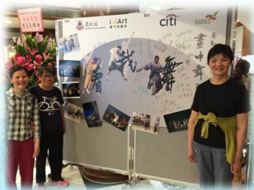
欣賞舞蹈表演，感受現場表演及舞台氣氛的震撼