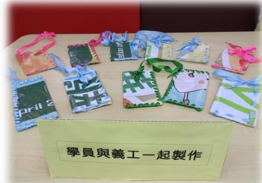
舊 BANNER 環保袋的成品