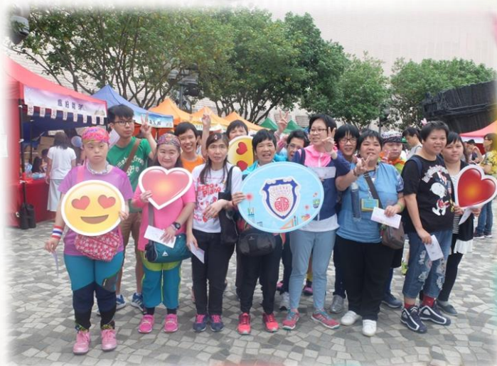
最後當然要拍照留念