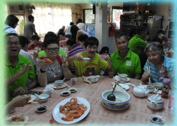
義工與學員共享美味海鮮餐