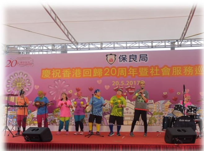
學員在台上毫不怯場，表演節奏樂