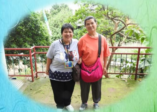
學員們欣賞大澳的美景，拍照留念