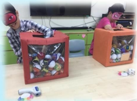
開心尋寶，刺激學員感官觸覺