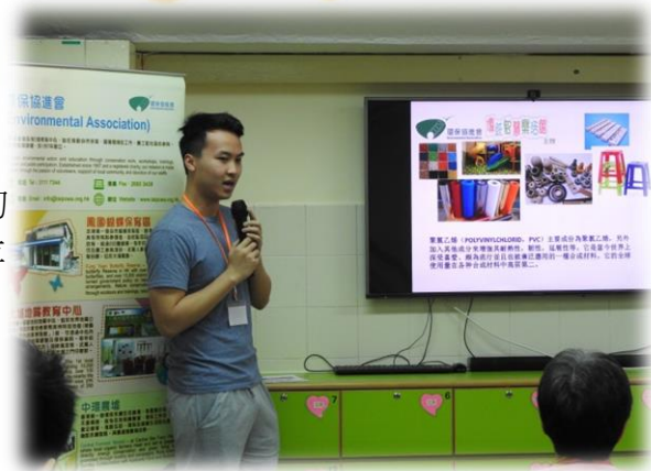
義工教導學員有關環保的知識及重要性