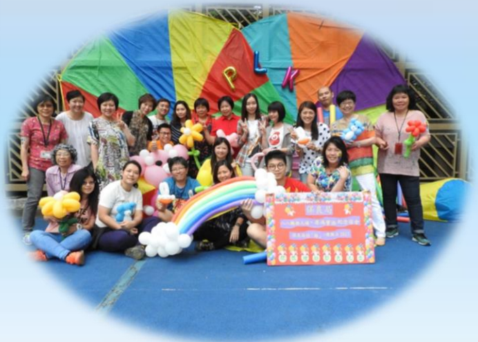
職員一同參與，展現團隊精神