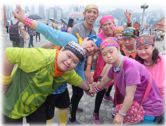
表演前先為自己打氣!