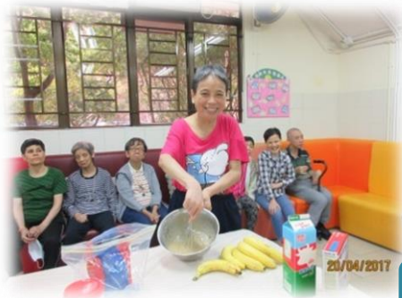
學員喜愛烹飪班，好玩又有得吃