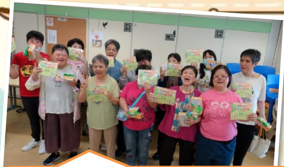
我哋成功啦 祝各位 25 週年回歸快樂!