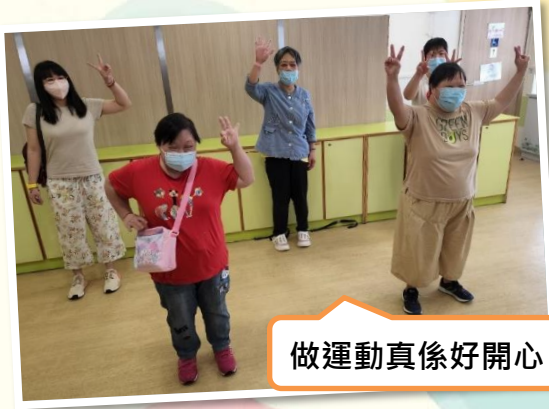
做運動真係好開心

今年是香港回歸祖國第 25 週年，為了慶回歸，深中舍友們決定一同身體力行，一連五日每天做 25 組運動，祝賀 各位第二十五週年回歸快樂，身體健康！