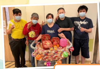
祝大家中秋節快樂!