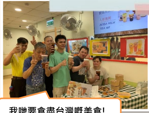
我哋要食盡台灣嘅美食!