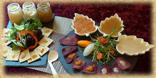
隨著節日來臨，本單位將會舉辦更多流心軟餐活動，如11月參觀流心軟餐製作及12月將舉行「流心聖誕大餐」，各位敬請密切留意。