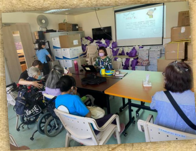
本單位於7月26日舉行「健康教育之流心軟餐初體驗」講座；通過活動介紹及現場講解製作軟餐過程。