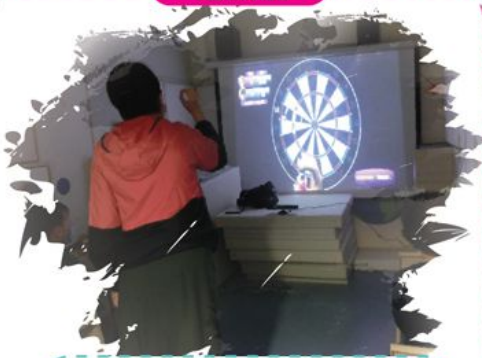
比分追得好貼啊，我要加把勁！