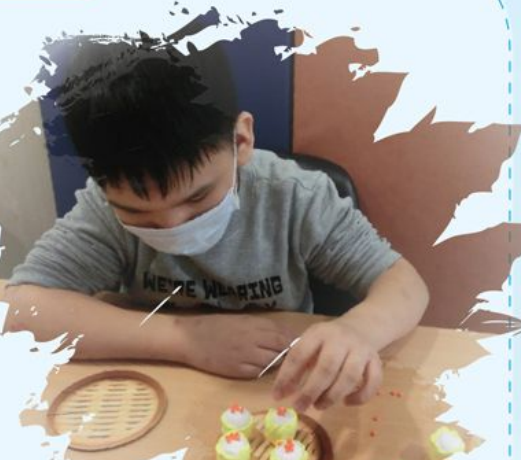
加多幾粒蟹籽落燒賣先～