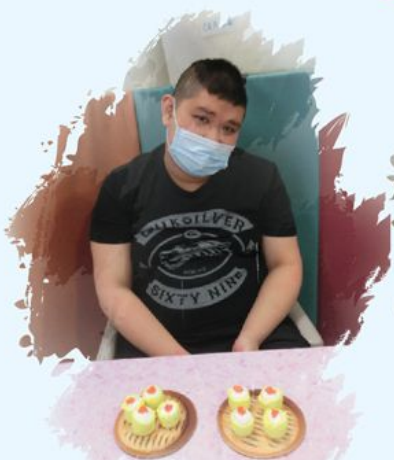
估唔估到邊一籠燒賣先係真嘍？