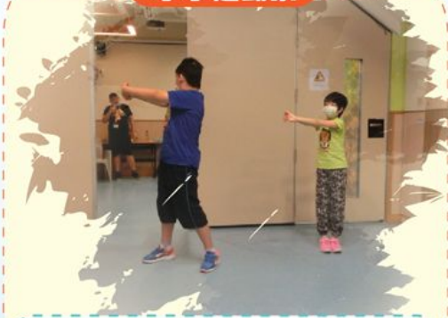
唔好淨係望住我哋，你都一齊做啦！～