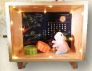
節慶主題場景 香薰/驅蚊蠟