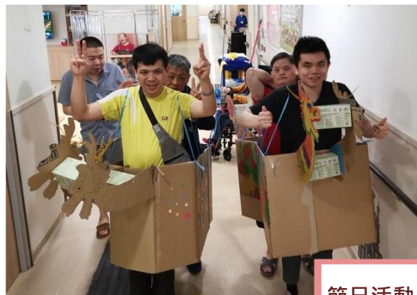
節日活動-陸上龍舟競賽