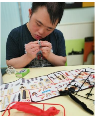
家多點愛-小模型大製作