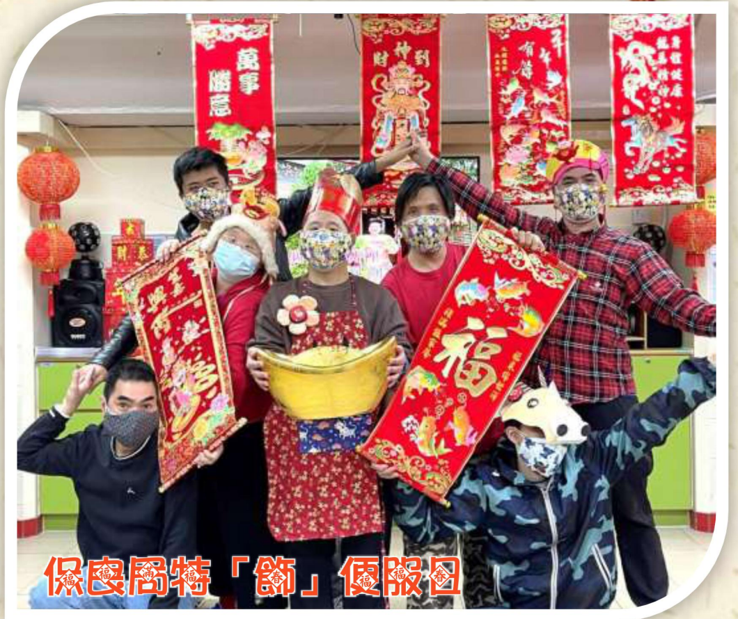
保良局特「飾」便服日

今年主題為『添「飾」添彩迎新禧』，學員以牛寶寶打扮，手持揮春在疫情下為大家付出的努力打打氣。