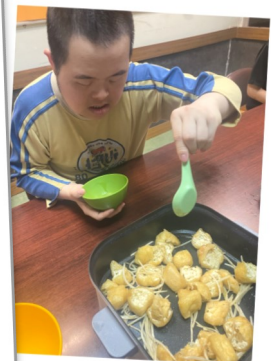
自家種植豆芽，吃落特別甜