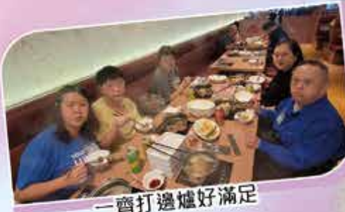
一齊打邊爐好滿足