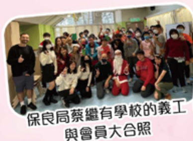
保良局蔡繼有學校的義工與會員大合照