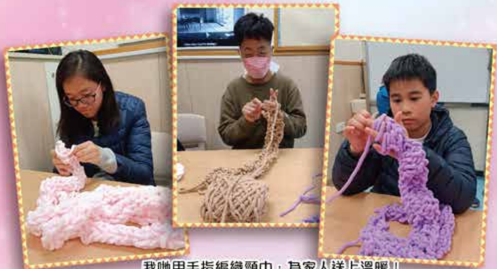
我哋用手指編織頸巾，為家人送上溫暖！