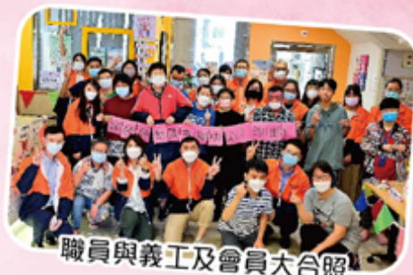
職員與義工及會員大合照

本年度的中心開放日已於2023年11月25日順利完成。除了向社區人士宣傳及推廣本中心之服務，更務求加強社區教育，促進傷健共融。