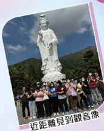
近距離見到觀音像