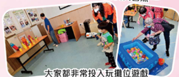
大家都非常投入玩攤位遊戲