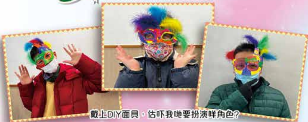
戴上DIY面具，估吓我哋要扮演咩角色？