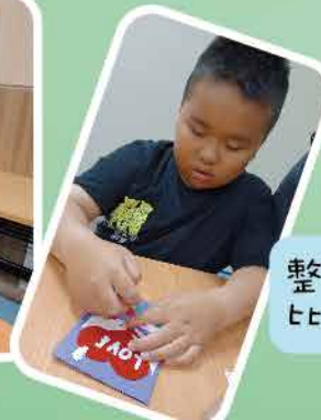
整張卡送 比屋企人