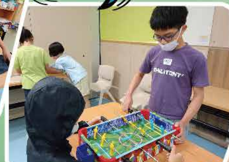
桌上遊戲，可以一齊玩