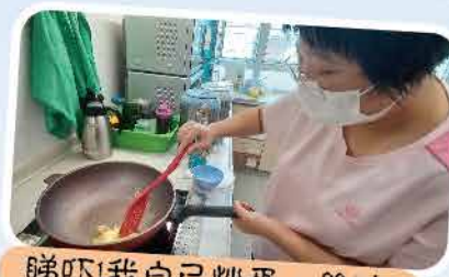
睇吓!我自己炒蛋，幾叻!