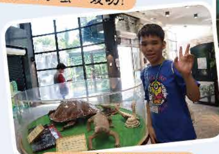
屯馬遊~參觀爬蟲館