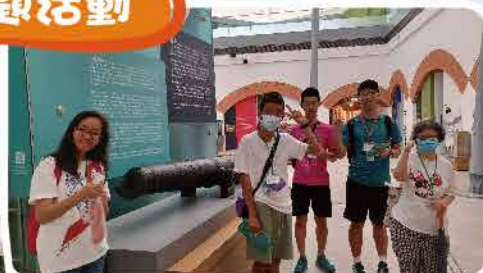
海防博物館，好多野睇呀~YEAH