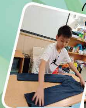
自理訓練~ 我學識練習褲