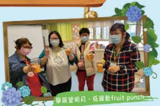
學願望明月，低頭飲fruit punch

香港疫情持續一整年，跳室感謝各會員和家長一年多的配合和體諒。第四波疫情漸漸減退，跳室的會員亦逐步增加，期望大家仍然奮勇抗疫，終有一日，跳室的所有導師和會員能夠除罩相見。會員加油！跳室加油！保良加油！