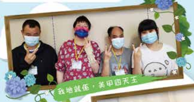
我地就係，美甲四天王