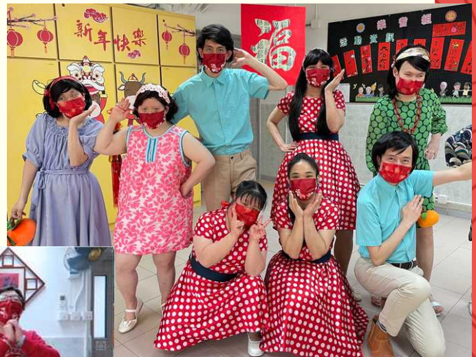
學員們表演舞蹈，氣氛十足