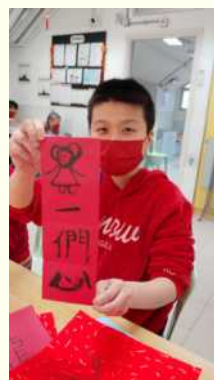
揮一揮大筆，寫出賀年揮春