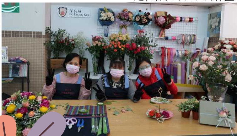
花藝組的學員即場示範製作襟花