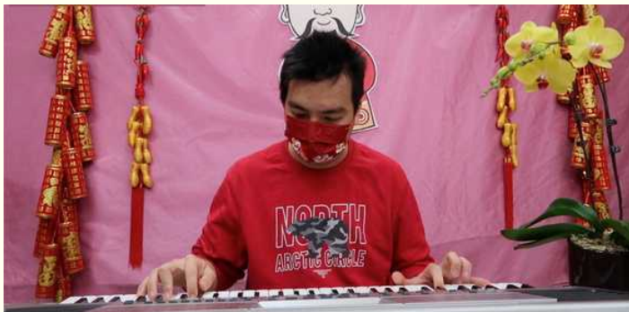
學員表演鋼琴獨奏

受疫情影響，農曆新年氣氛減退，而拜年的機會亦不敵取消。因此保良局安老和康復服務聯手製作了賀歲特輯。而工場及宿舍當然要大展身手，安排了學員以鋼琴獨奏及懷舊經典60年的Chat Chat與大家拜年。令大家收看後亦感到喜氣迎春，歡樂滿盈。