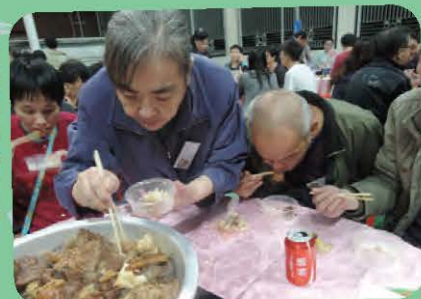
美味的盆菜,吃得舍友津津有味