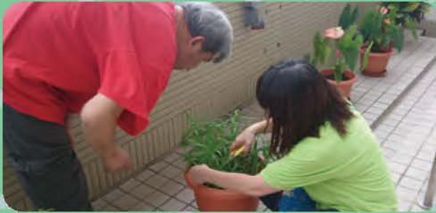
職員正教授舍友分株及除草技巧