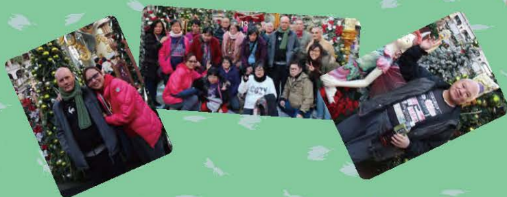
職員帶領舍友到尖沙咀欣賞燈飾,感受節 日氣氛,同時亦和舍友吃一頓豐富的聖誕 大節