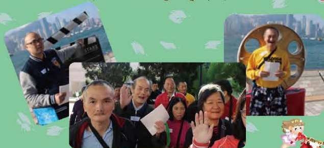
賣旗也不妨為尖沙咀地區帶來我們的歡笑