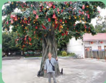
在林村樹下許願,祝大家 新一年身體健康!