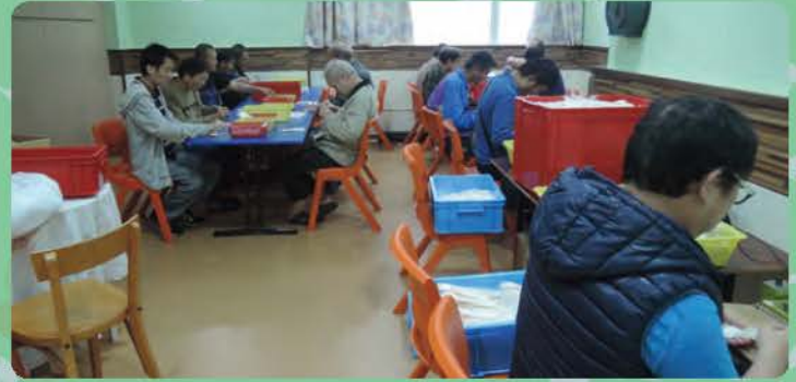
舍友分工合作地進行包裝工作,默契十足

在11月,中心的包裝工作訓練已順利建立,透過模擬工作活動,不單培養舍良好的工作習慣,更配合舍友的工作興趣發展和社交需要安排合適的訓練崗位。讓參與舍友提昇工作信心和責任感,以及與人合作應有的態度。