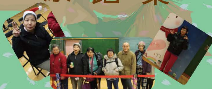
職員帶舍友到友愛體育館參加 復康舞蹈同樂日,與大家歡聚聖誕 的來臨