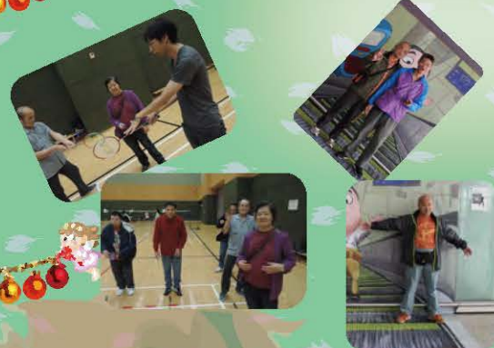
在國際復康日,職員分別帶領舍友到機 場遊覽以及免費租用康體設施做運動