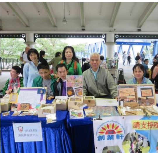
活動名稱：天星展銷 日期：17/11/2018