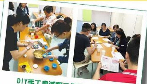
DIY手工自減壓工作坊 (13/10/2016)