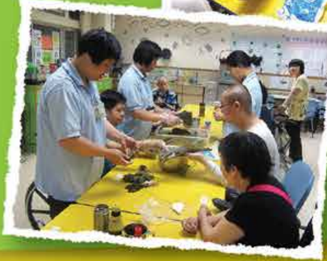
康悅宿舍(嚴重殘疾人士護理院)(C&A/SD)