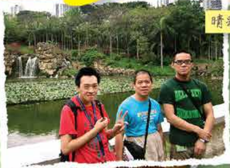
晴彩居(SHOS)、晴昕居(HSMH)、晴暉居(HMMH) (弱智男宿舍)