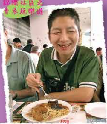
康逸居(LSCH)(長期護理院)(男宿)