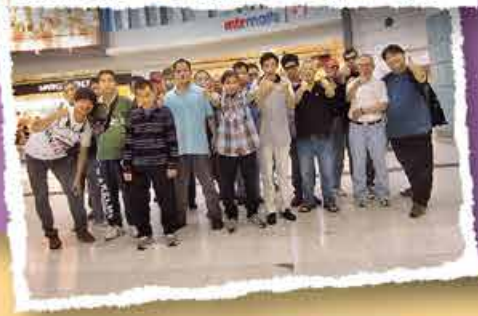
康逸庭(LSCH)(長期護理院)(女宿)