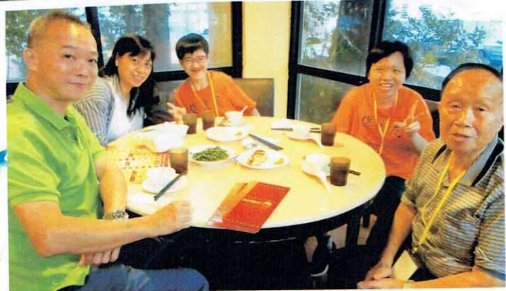
旅行好處：除了品嚐台灣美食，也可以互相了解