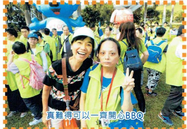
真難得可以一齊開心BBQ