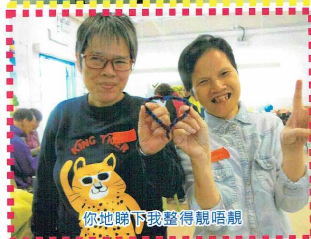
你地睇下我整得靚唔靚