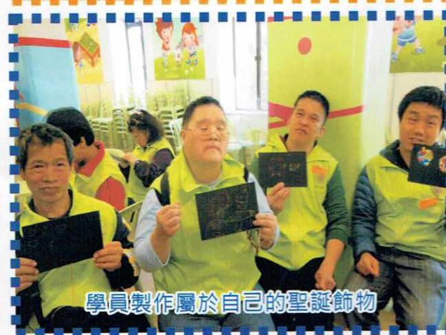
學員製作屬於自己的聖誕飾物