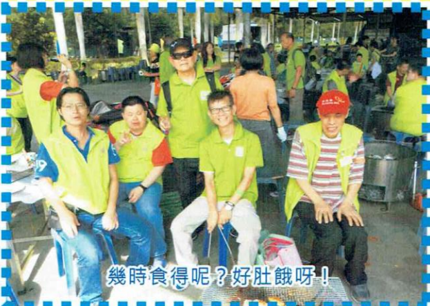
幾時食得呢？好肚餓呀！