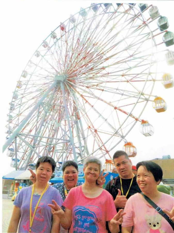
高雄摩天輪特別靚