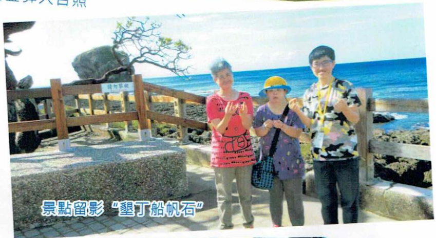
景點留影「墾丁船帆石」