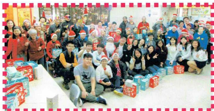
2016. 10. 21 保良局蔡繼有學校探訪