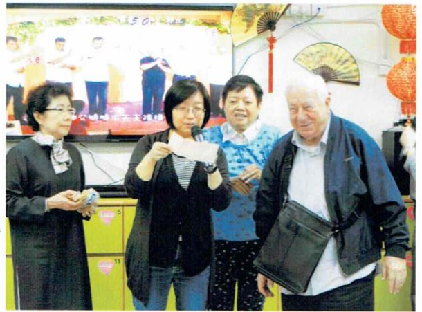
神父充當翻譯員讓意大利義工可以玩搶答題