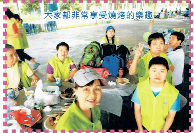
大家都非常享受燒烤的樂趣