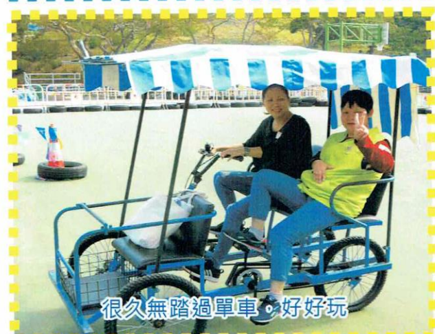
很久無踏過單車，好好玩