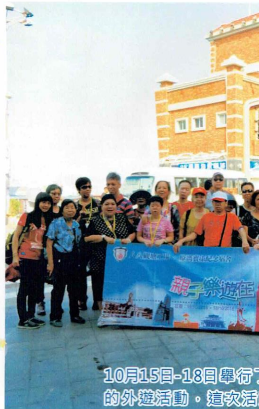
10月15日-18日舉行的外遊活動。這次活見聞讓學員及家長歡