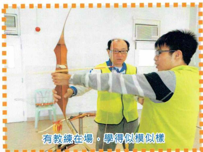
有教練在場，學得似模似樣