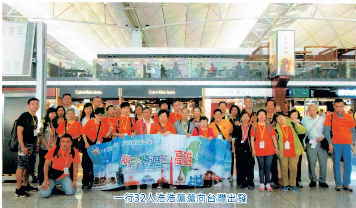
一行32人浩浩蕩蕩向台灣出發