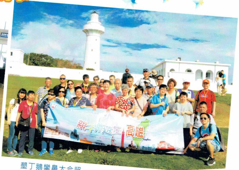
墾丁鵝鑾鼻大合照