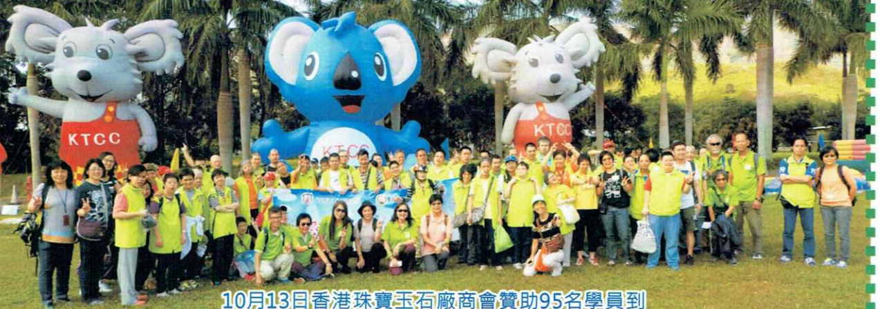
10月13日香港珠寶玉石廠商會贊助95名學員到元朗錦田鄉村俱樂部燒烤，我們渡過了愉快的一天。