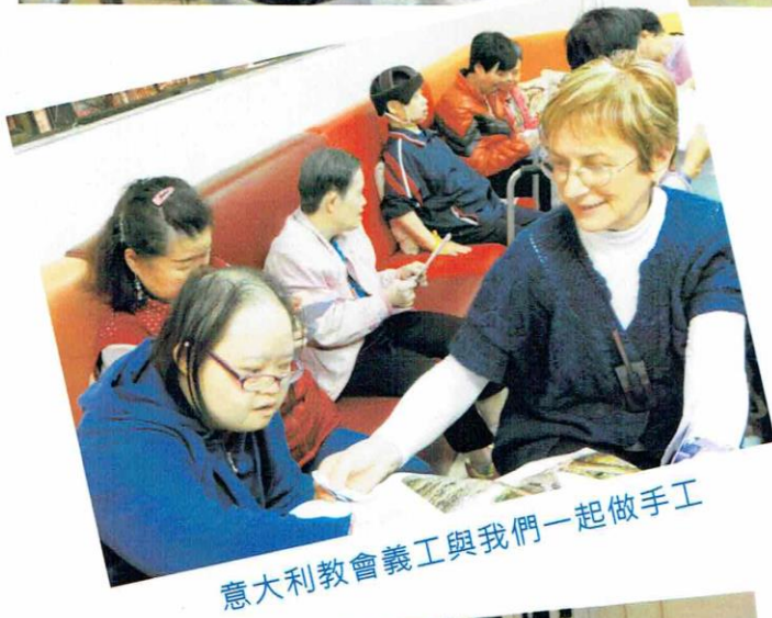
意大利教會義工與我們一起做手工