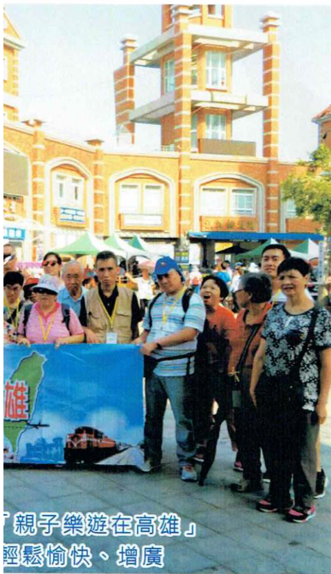
「親子樂遊在高雄」 輕鬆愉快、增廣 四天愉快旅程。