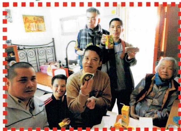
2016. 12. 10 冬至關懷送暖齊開心