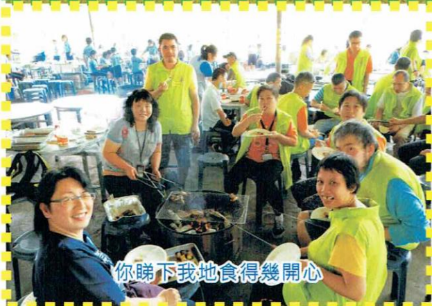
你睇下我地食得幾開心