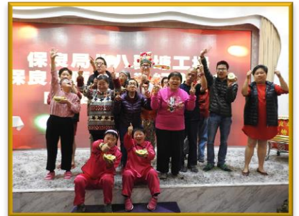
學員與財神大合照。