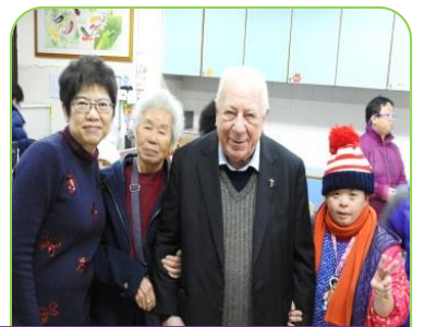
2月26日 ~ 信望愛賀新春 12名信望愛義工和學員品嚐到會的自助餐，學員表演跳舞「同賀新春」，獲得熱烈掌聲，大家渡過一個開心溫馨的晚上。