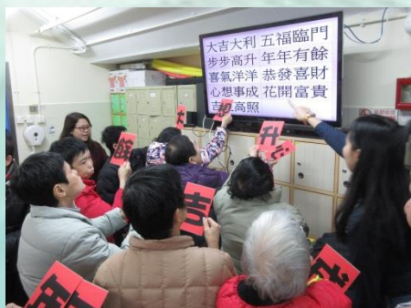
2月18日~義工探訪 學員投入互動遊戲玩樂中。