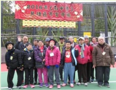
學員逛年宵花市，感受新春節日氣氛。