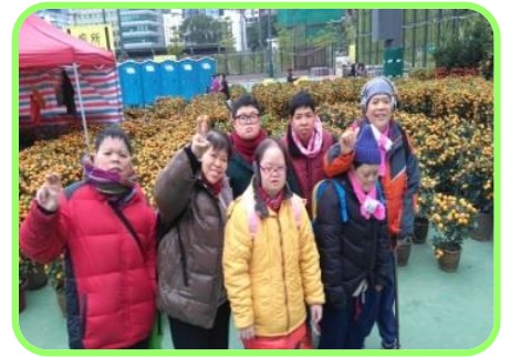
2月3日~行花市 學員在年宵花市購買賀年食品和賀年花卉，感受農曆新年的節日氣氛。