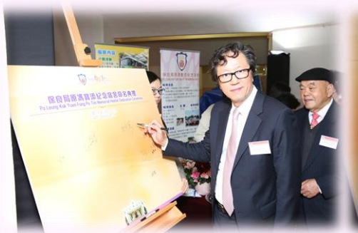
嘉賓於接待處提名