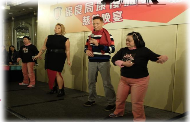
3位學員於2016年1月19日參與康復服務慈善晚宴，他們與演藝嘉賓鄭欣宜小姐以歌聲及手語演繹歌曲「擁抱愛」，深受嘉賓讚賞。