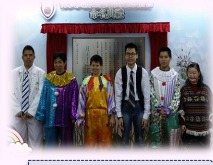
魔術表演學員合照留念