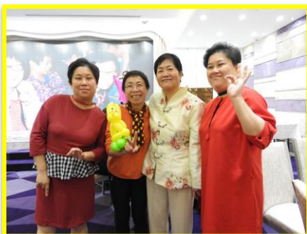
與家人參加晚宴，陪感開心.....