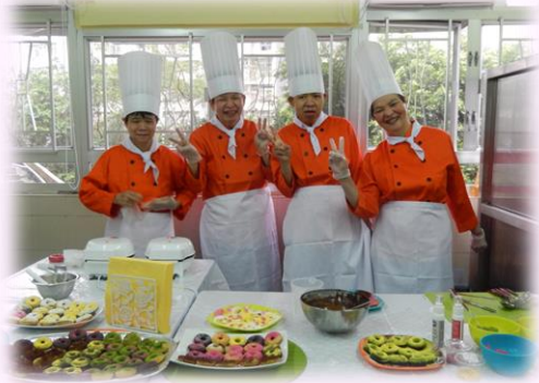
學員親手製作小麥草汁及冬用