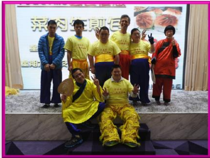
醒獅表演，為活動揭開序幕！

工場及宿舍於 2016 年 3 月 6 日舉辦一年一度的春茗活動，當晚共有 81 名家屬、68 名學員及 6 名義工出席；活動當日節目豐富，除有醒獅、魔術、唱歌及手語表演之外，更有抽獎及集體遊戲，家屬、學員、義工及職員們彼此打成一片，熱鬧非常，大家渡過了一個開心的晚上。