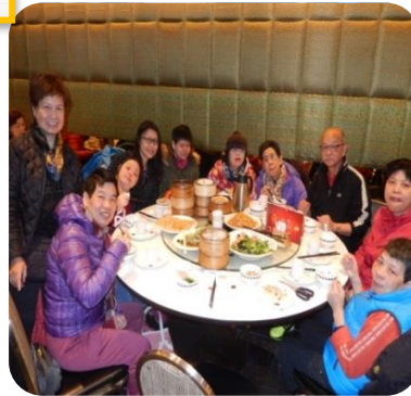
2月10日 ~ 初三行大運 39名學員往觀塘大型商場看電影及享用午膳，歡渡新春。