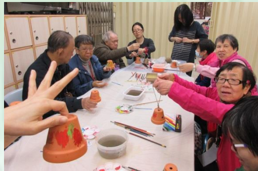
9節園藝治療小組讓學員學習種植不同的小盆栽。