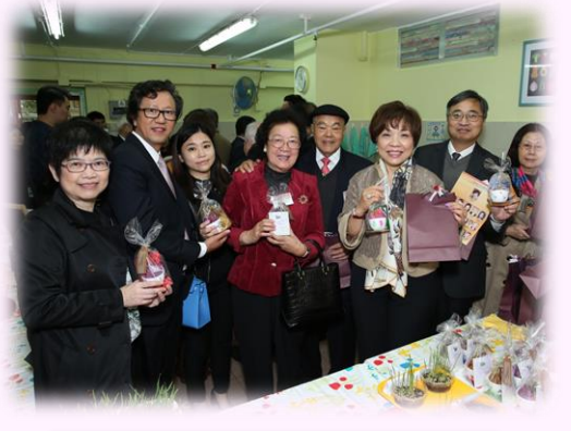
小麥草盆栽紀念品製作