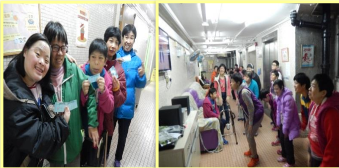
3月4日 ~ 健腦操比賽 學員跟著音樂跳舞，宣揚做運動的益處。