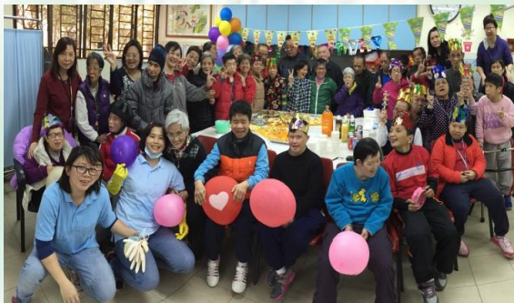
3月31日舉行生日聯歡會，開心大合照！