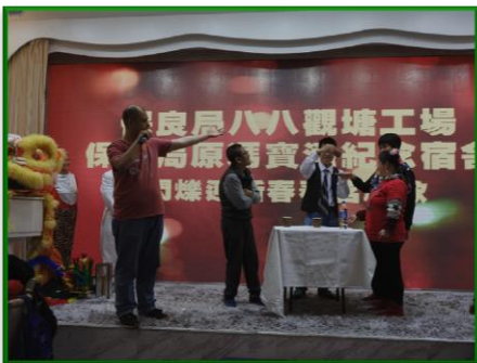
魔術表演，目不暇給。