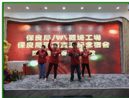
學員以唱歌及手語演繹歌曲，贏得不少掌聲。