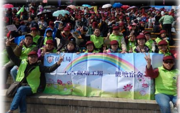
2016年2月20日參加保良局慈善步行活動，工場及宿舍共13位學員、2位家屬參與其中，當日大家身體力行齊做善事，再次多謝各位善長的支持。