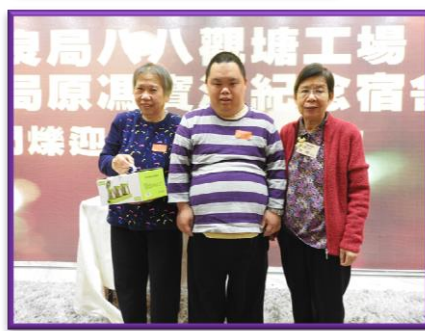
抽到大獎，興奮非常！