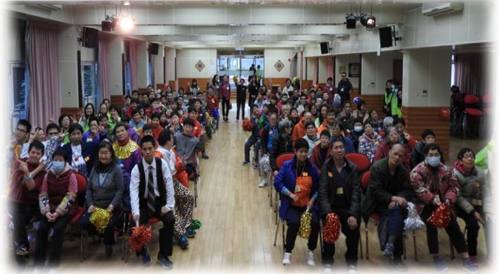
集體互動遊戲玩樂