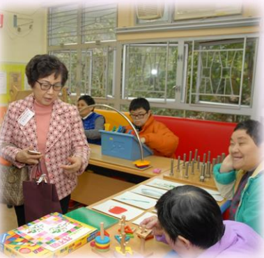
學員示範使用健身及復康器材