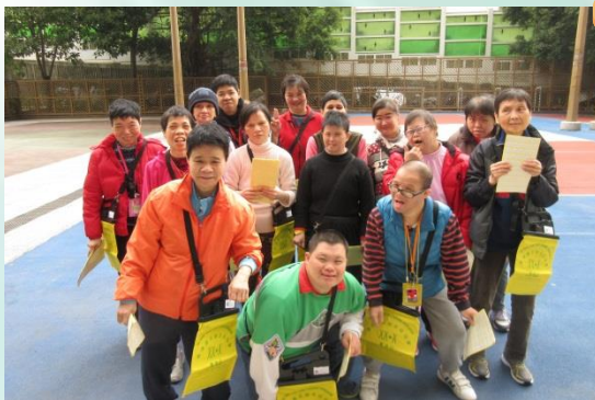
2月13日~義工服務 學員踴躍參與賣旗活動。