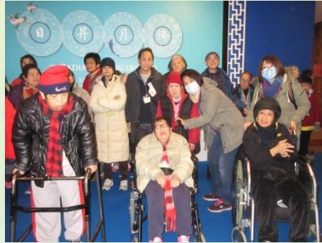
1月27日 參觀博物館展覽「日昇月騰文物展覽」。