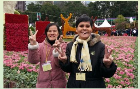
3月11日維園花展留倩影。