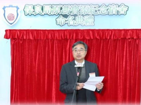
社會福利署方啟良助理署長致辭