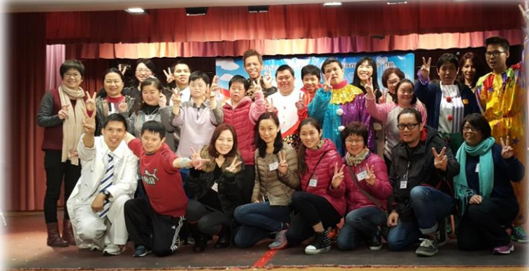
學員以唱歌及手語演繹歌曲「擁抱愛」