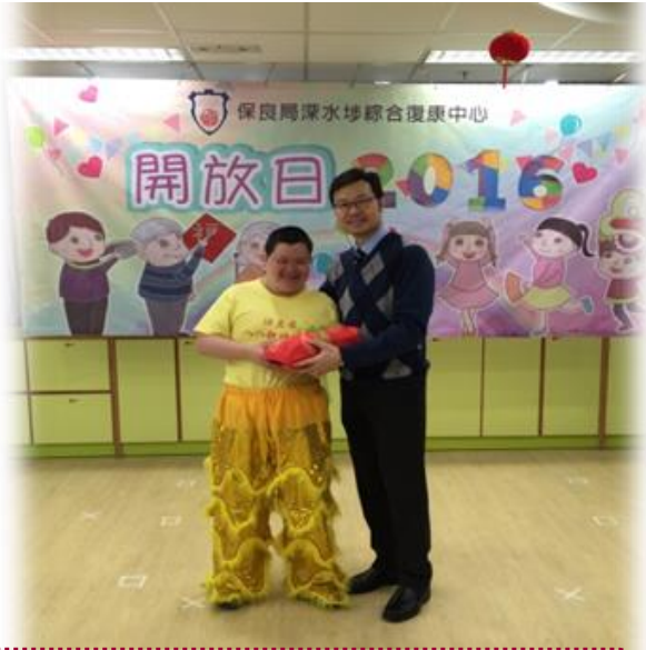
9位學員於2016年2月27日參與深水埗綜合復康中心開放日的表演項目，學員當日表演醒獅擊鼓，令現場充滿熱鬧的氣氛。