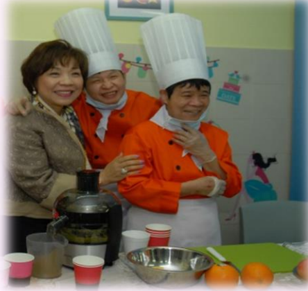
水墨畫及手工藝製作示範