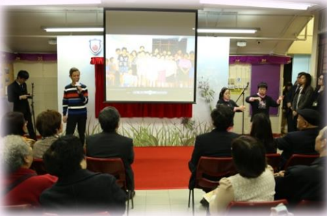
學員以唱歌及手語演繹歌曲「獅子山下」及「擁抱愛」，同場播放宿舍回憶片段。