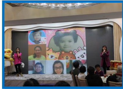
集體互動遊戲，反應熱烈！