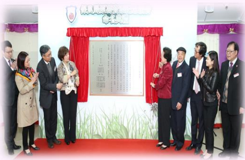
碑記揭幕儀式後來個大合照