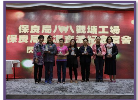
頒發紀念品予義工，感謝義工的付出！