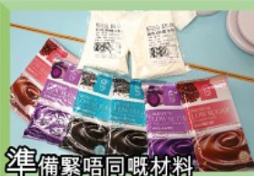
準備緊唔同嘅材料