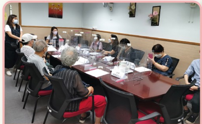
一眾家長及職員開會了解最新情況

家職會議已於9月9日舉行，當日有8位家屬代表出席，服務經理在會上向家屬介紹中心的最新防疫安排及員工防疫的工作，讓家屬了解有關事宜的進展。此外，會上安排家長試食由局方廚師研習及創作的流心餐，供有咀嚼或吞嚥困難的舍友享用。家屬在試食後，亦提出了不少意見，有助我們為舍友製作有「營」有「相」的食物，讓他們重拾膳食的色香味。