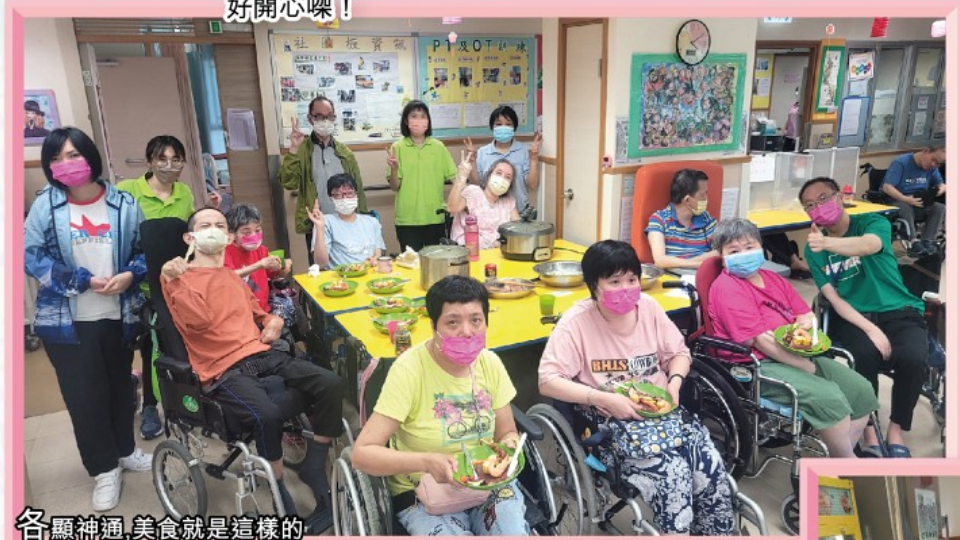
各顯神通,美食就是這樣的

院舍生活樂趣多多，雖然未能齊齊外出聚餐，但是自己動手一樣可以享用饕餮盛宴，有舍友幫手洗菜摘菜，有舍友做燒烤大王，串燒做到外焦內嫩；有舍友做的沙律美味滿分；有舍友煎的牛扒更是色香味齊，哈哈！有機會來參加我們的房間活動呀，好開心㗎！