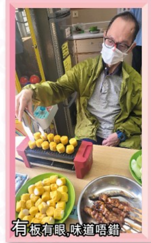
有板有眼,味道唔錯