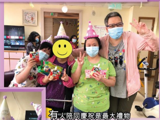
有人陪同慶祝是最大禮物