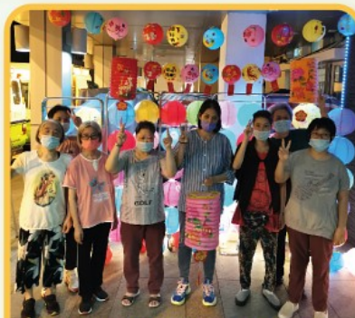
細個玩燈籠嘅感覺返晒嚟