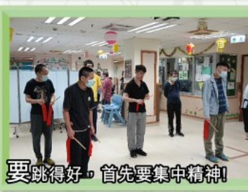
要跳得好，首先要集中精神！