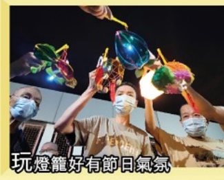
玩燈籠好有節日氣氛