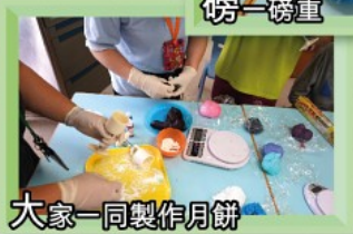
大家一同製作月餅