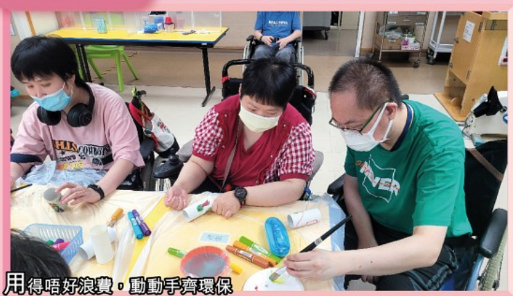
用得唔好浪費，動動手齊環保