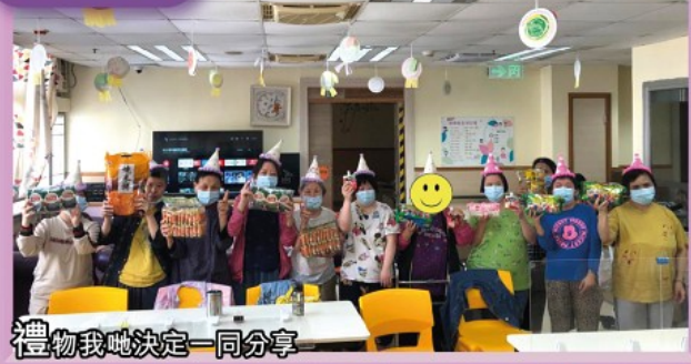
禮物我哋決定一同分享