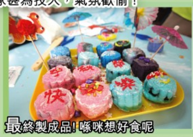
最終製成品！啱咪想好食呢