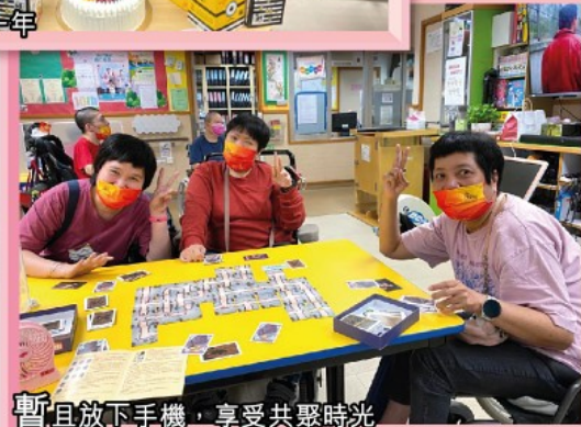
暫且放下手機，享受共聚時光