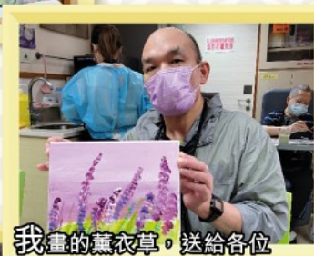
我畫的薰衣草，送給各位