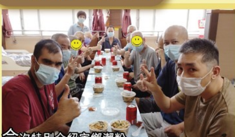
今次特別介紹家鄉瀨粉