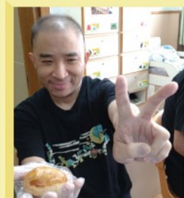
中式唐餅平日很少機會食到，好味道呀！