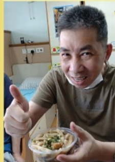
傳統家鄉瀨粉好味