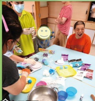
舍友正學習如何製作月餅

今年我們一眾同事為了與各舍友一同共賀中秋節，特意舉辦了自製中秋月餅慶祝活動。每個五彩繽紛的月餅也是由同事和舍友共同製作的！大家可以在這喜慶節日內，自行選擇自己喜愛的外皮顏色、參與月餅搓粉和倒模，並見證着整個月餅成形！過程中大家甚為投入，氣氛歡愉！