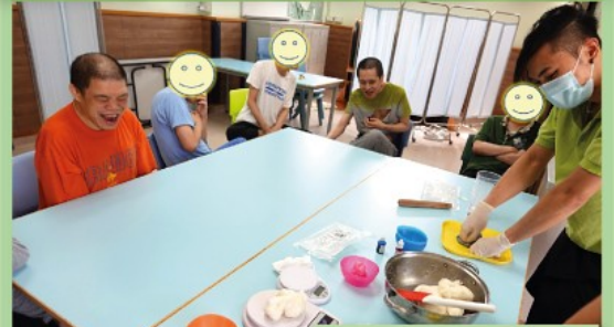
好期待見到個成果啊