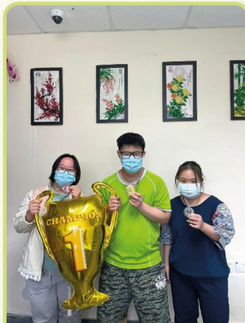
得獎者嚟番張大合照先La~