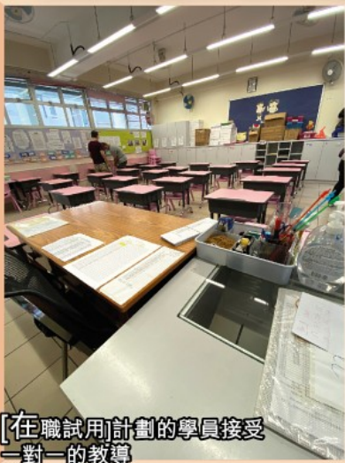
[在職試用]計劃的學員接受一對一的教導

在輔助就業服務中，除了在工場內接受職業相關訓練外，社工亦會與外間僱主、負責人和營辦機構接洽和聯繫，商討和安排 [見習] (Job Attachment) 或 [在職試用] (Job Trial) 崗位，期間會跟進學員之進度及適應方面的問題。