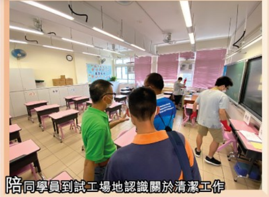
陪同學員到試工場地認識關於清潔工作