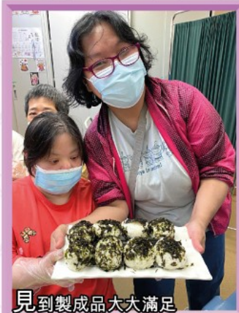
見到製成品大大滿足