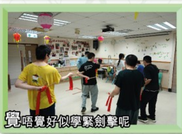
覺唔覺好似學緊劍擊呢