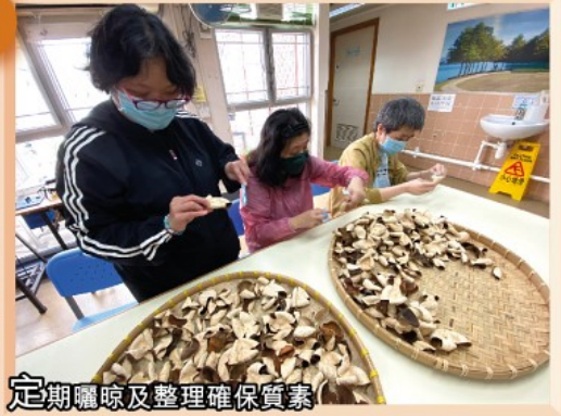
定期曬晾及整理確保質素