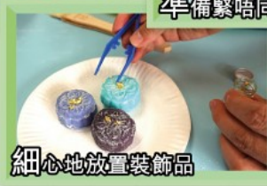
細心地放置裝飾品