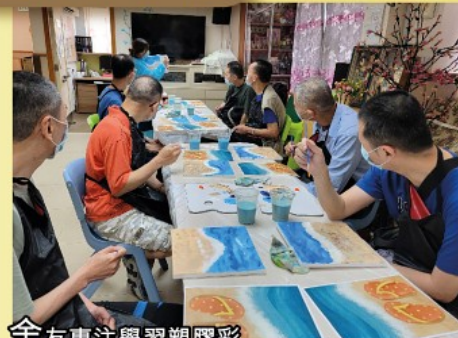
舍友專注學習塑膠彩