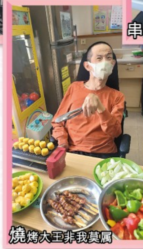
燒烤大王非我莫屬