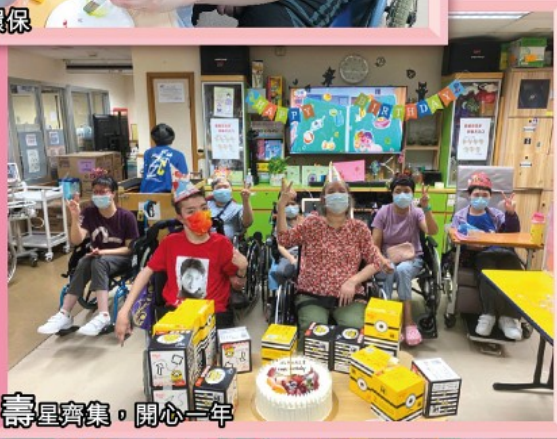
壽星齊集，開心一年