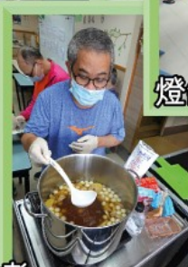
煮啊煮，望到都想食