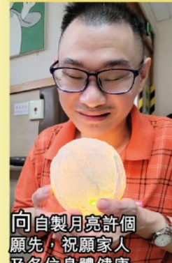
向自製月亮許個願先，祝願家人及各位身體健康