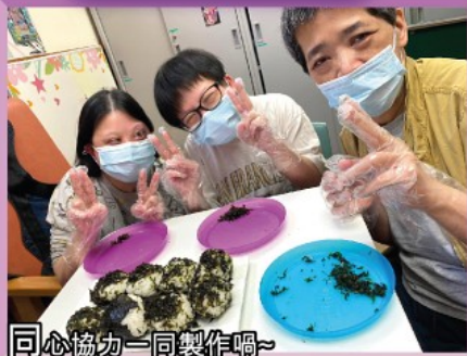
同心協力一同製作嗰~