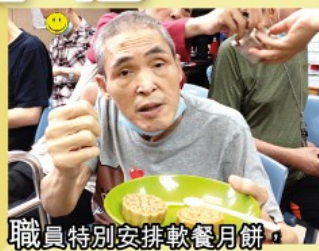
職員特別安排軟餐月餅，真係要比個Like先得