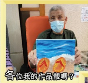
各位我的作品靚嗎？