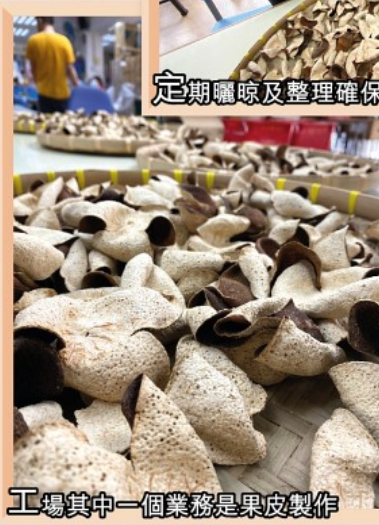
工場其中一個業務是果皮製作