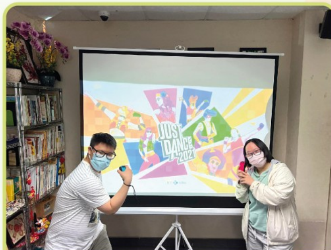
終於嚟到決賽舞台Lu!!!!