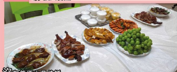
沒有美酒也是佳節