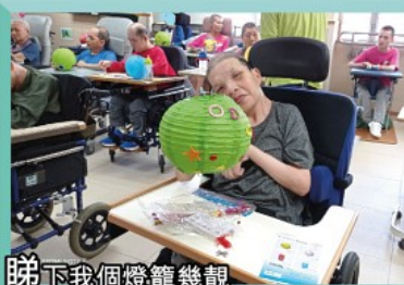
睇下我個燈籠幾靚