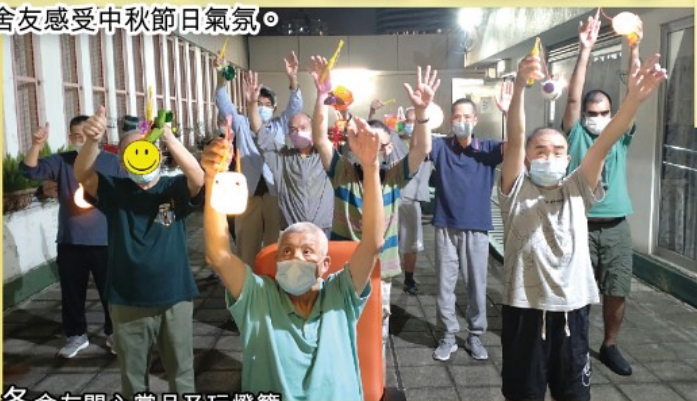
各舍友開心賞月及玩燈籠

今年中秋活動「齊齊整整慶中秋」特別預備中秋佳節美食、水果、軟餐月餅、猜燈謎、玩燈籠和賞月，讓舍友感受中秋節日氣氛。