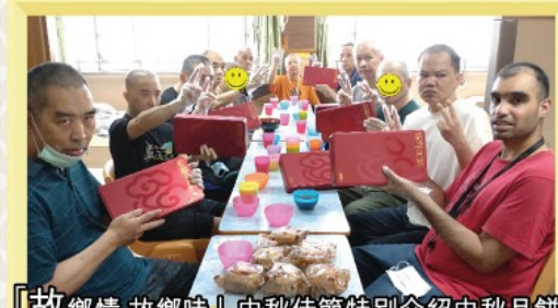
「故鄉情 故鄉味」中秋佳節特別介紹中秋月餅