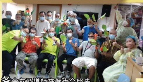
各舍友及導師來個大合照先