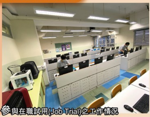
參與在職試用(Job Trial)之工作情況