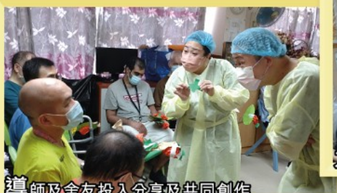
導師及舍友投入分享及共同創作