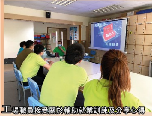
工場職員接受關於輔助就業訓練及分享心得