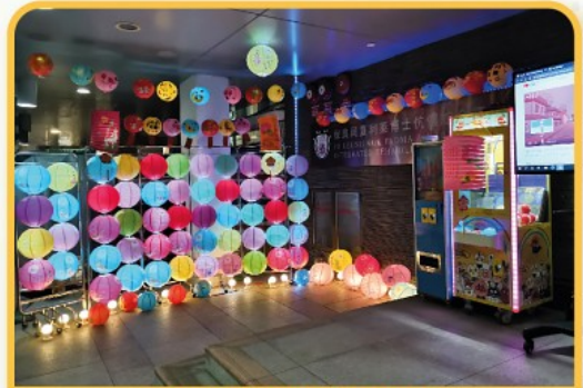
團團圓圓暖暖中秋夜