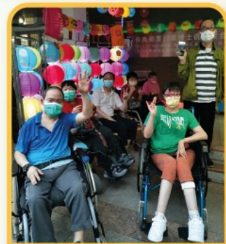
中秋點可以無我哋撐場