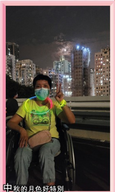
中秋的月色好特別