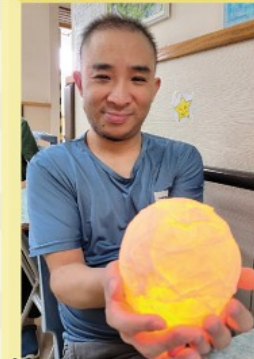
這是我自製的手工月亮