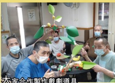
大家合作製作戲劇道具