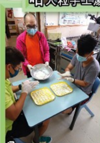
分工合作先有效率