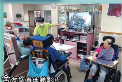
舍友認真地睇影片