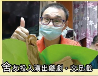
舍友投入演出戲劇，交足戲