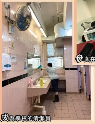
成為學校的清潔員