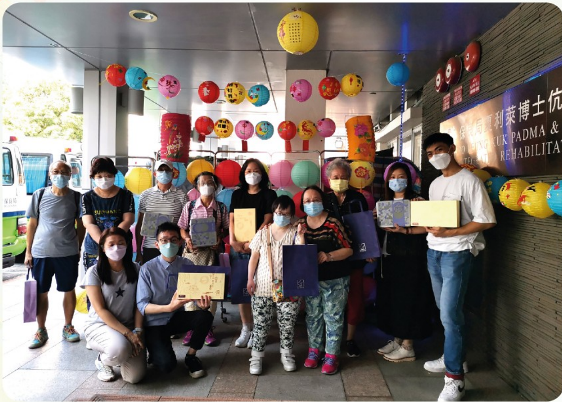
一眾家長與職員代表拍攝大合照留念

家職會議已於9月9日舉行，當日有8位家屬代表出席，服務經理在會上向家屬介紹中心的最新防疫安排及員工防疫的工作，讓家屬了解有關事宜的進展。此外，會上安排家長試食由局方廚師研習及創作的流心餐，供有咀嚼或吞嚥困難的舍友享用。家屬在試食後，亦提出了不少意見，有助我們為舍友製作有「營」有「相」的食物，讓他們重拾膳食的色香味。