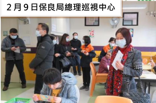
2月9日保良局總理巡視中心